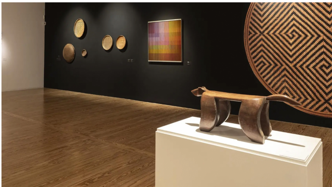
Vista de la exposición 'Convergencias / Divergencias. Dos estéticas en diálogo'.

Respuesta. La cestería yek'wana es una expresión estética original, proveniente de culturas indígenas originarias del Amazonas que forman parte de la universalidad estética. Sin embargo, en esta exposición, Convergencias y Divergencias, dos estéticas en diálogo , la curaduría de Ariel Jiménez trata de estudiar los posibles encuentros entre las expresiones estéticas primeras con lo moderno y contemporáneo.