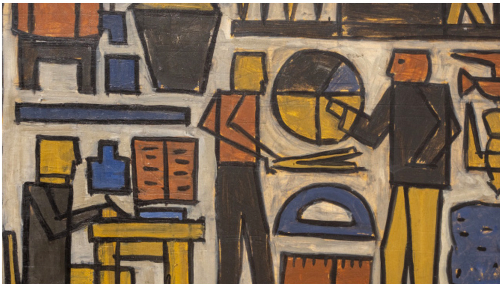
▲ Detalle de una de las piezas de la exposición Casa de América

Otro vértice por el que se tocan ambas producciones artísticas es el uso de las formas geométricas más esenciales y el empleo "franco y directo", señalan, de las herramientas plásticas (color, dibujo, textura); "o la representación similar de símbolos", añade el comisario: "En Torres García, vemos seres humanos, hombres, mujeres, instrumentos de trabajos, animales, aves...; y en los yekuanas, ranas, monos, estrellas... Todos ellos representados de una manera esquemática muy parecida" .