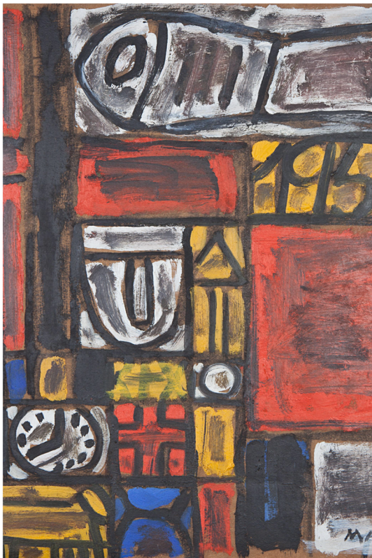
Sin título , de Francisco Matto (1911-1995).