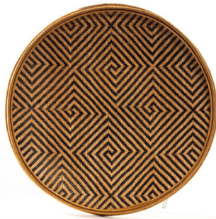
Cesta ye'kwana. Rafael Guillén