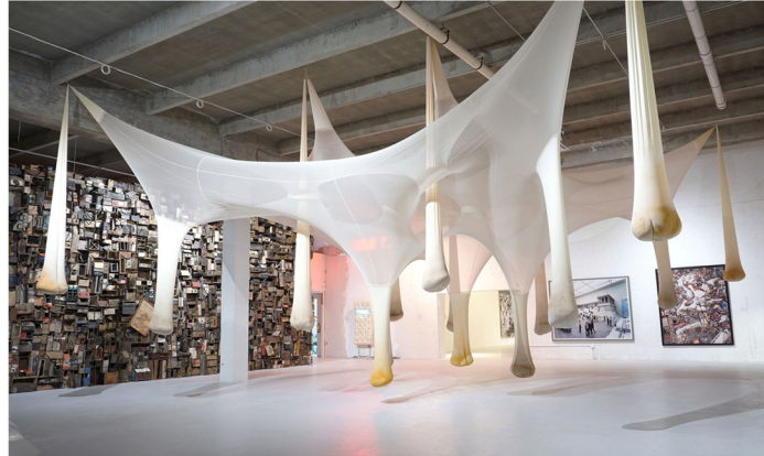
Descubra peças únicas em The Margulies Collection at the Warehouse