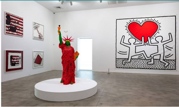
Spend a day exploring the Rubell Museum